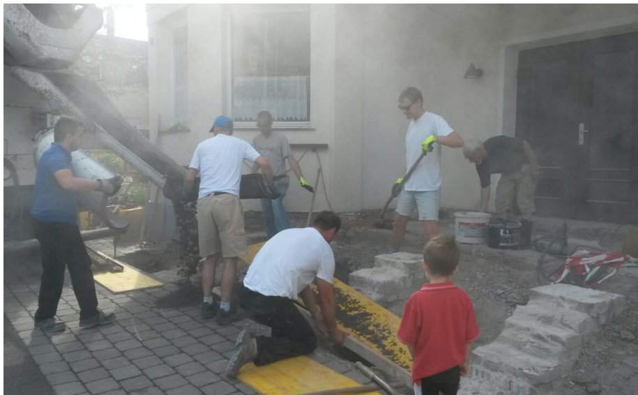
Baueinsatz im Vereinshaus – Herzlichen Dank an alle Helfer!