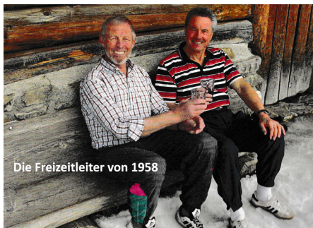
Die Freizeitleiter von 1958

Das ist das Bänkli neben dem Eingang zum Holzstall. Wenn man vom Skifahren oder Wandern zurückkommt, schmeckt dort ein Glas Wein besonders gut. Aber auch von der Terrasse das Panorama aufschauen oder bei Schneetreiben an den warmen Ofen lehnen gehört dazu.