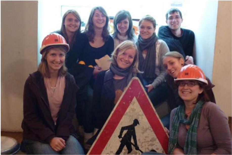
Mitarbeiter-WG "Baustelle Leben"