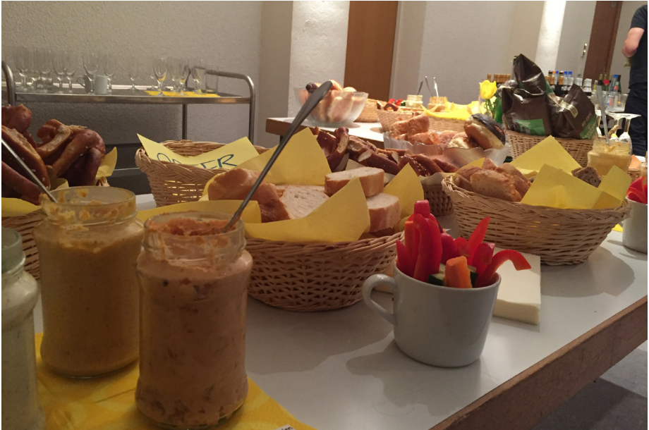
Leckerer Fingerfood bei der Mitgliederversammlung